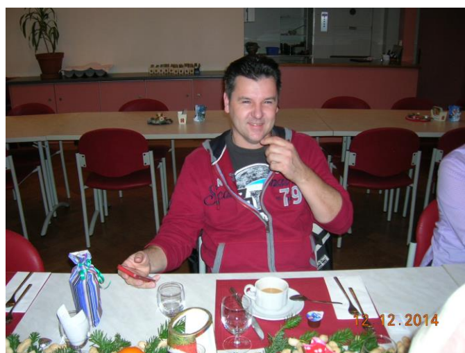
Hier einige Fotos. Ganz herlichen Dank.