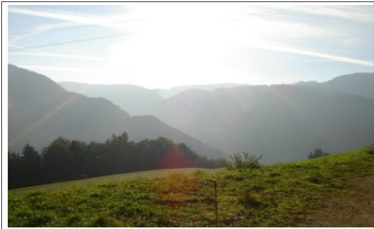
Herbst im JURA