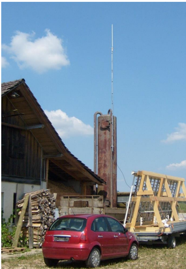
Fertig montiert am Silo