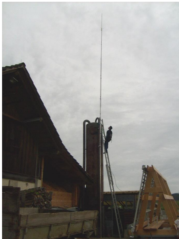
HB3YWD bei der Montage der Antenne