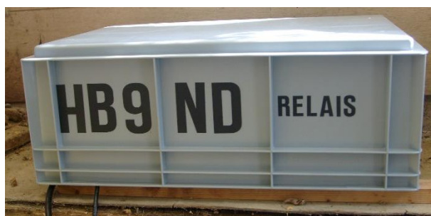
Deckel drauf und los