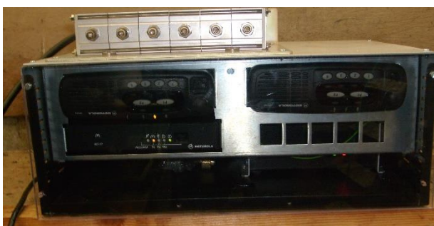
70cm Relais Motorola